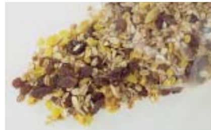
Mit Sultaninen geizt Aldi (Nord) nicht.