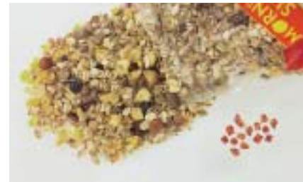
Was ist was? Winzige Fruchtstücke bei Plus.