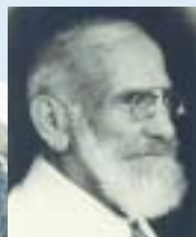
Müsli-Urvater Maximilian Bircher- Benner.

Eine Sennerin bewirtete den Arzt Maximilian Bircher-Benner (1867 bis 1939) mit einer Rohkost-Mahlzeit wie sie die Almhirten vor über 100 Jahren zu sich nah-