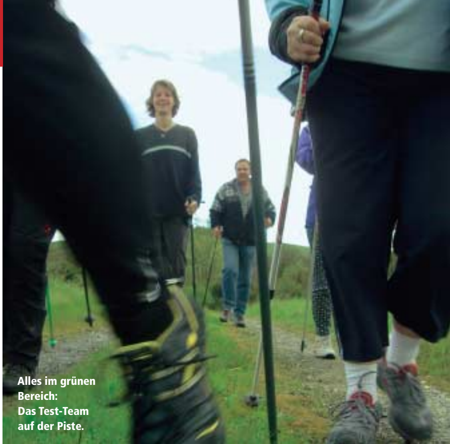
Alles im grünen Bereich: Das Test-Team auf der Piste.