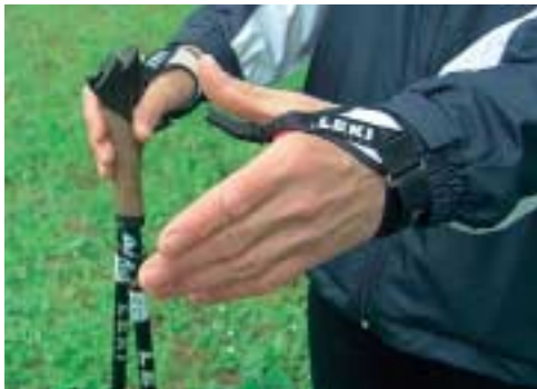
FREIE HAND: Beim Leki Flash Carbon lässt sich die Schlaufe mit einem Griff vom Stock lösen.

Nachteilig bei den meisten Teleskopstöcken sind das höhere Gewicht und die etwas schlechtere Balance sowie der höhere Pflegeaufwand. Bei einigen Modellen im