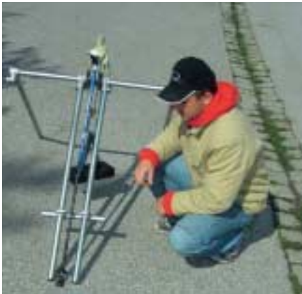
Der Stock hält: Überprüfung der Rutschfestigkeit (Grip) des Pads auf Asphalt.

Die von uns getesteten Schuhe in der Preiskategorie bis 120 Euro waren in ihrer Mehrzahl recht ordentlich. Eine negative