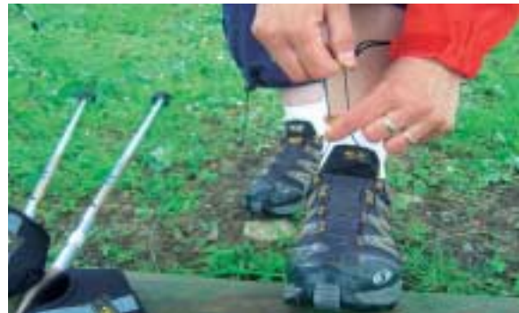
GUT IM GRIFF: Die Schuhe von Salomon lassen sich besonders komfortabel schnüren.

Bevor Sie sich in Ausgaben stürzen, sollten Sie testen, ob Ihnen Nordic Walking liegt. Dafür reichen normale Laufschuhe und ausgeliehene Stöcke. Sagt Ihnen der Sport zu, kommen Sie nicht an Spezialschuhen vorbei. Unter den „guten“ Schuhen ohne Membran hat erfreulicherweise der billigste am besten abgeschnitten: Reebok Sporterra DMX (75 Euro). Besonders gute Eigenschaften bei Nässe haben Schuhe mit Feuchtigkeitsmembran, wie am Beispiel des Salomon XA Comp XCR für happige 120 Euro zu sehen ist. Für „gute“ Markenstöcke müssen Sie nicht mehr als 50 Euro ausgeben: Ob Sie einen Teleskopstock wie Komperdell Spirit II oder einen mit fester Länge wie Fizan NW nehmen, ist Geschmackssache. Der beste Stock unter den „Guten“ – Leki Flash Carbon – ist mit 79 Euro allerdings etwas teurer.