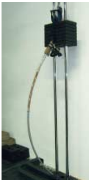
Härtetest im Labor: Links im Bild die Prüfung der Haltbarkeit von Stöcken. Unten wird die Dauerbiegefestigkeit der Schuhe in 30 000 Hüben getestet. Rechts eine typische Handschlaufe der Stöcke.

Schuhe und Stöcke für Nordic Walking Schuhe, Stöcke, Kursgebühren – der Start in die neue Sportart Nordic Walking kann teuer werden. Wir zeigen, womit Sie nicht am Stock gehen.