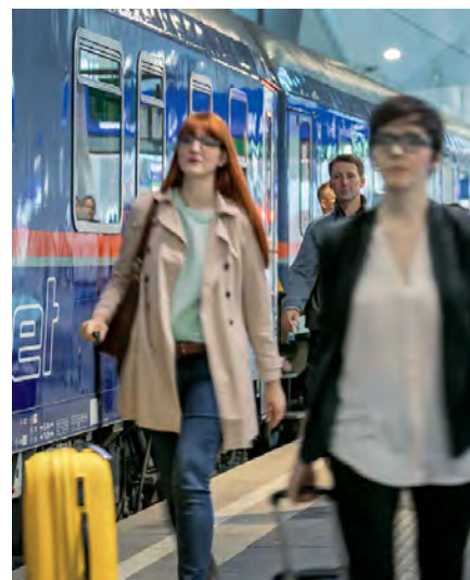
Ankommen. Mit dem Nachtzug sollen Reisende ausgeruht am Ziel eintreffen.