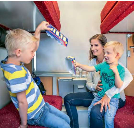
Im Liegewagen. Dieses Abteil im ÖBB-Nightjet bietet Platz für vier Betten.