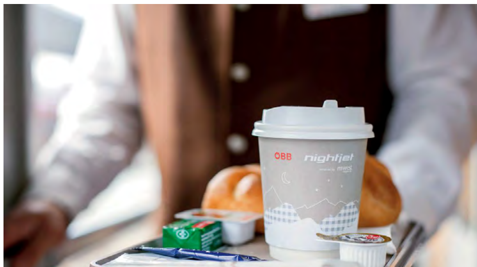
Service. Das Frühstück ist im Schlafwagen inklusive, sonst optional buchbar.