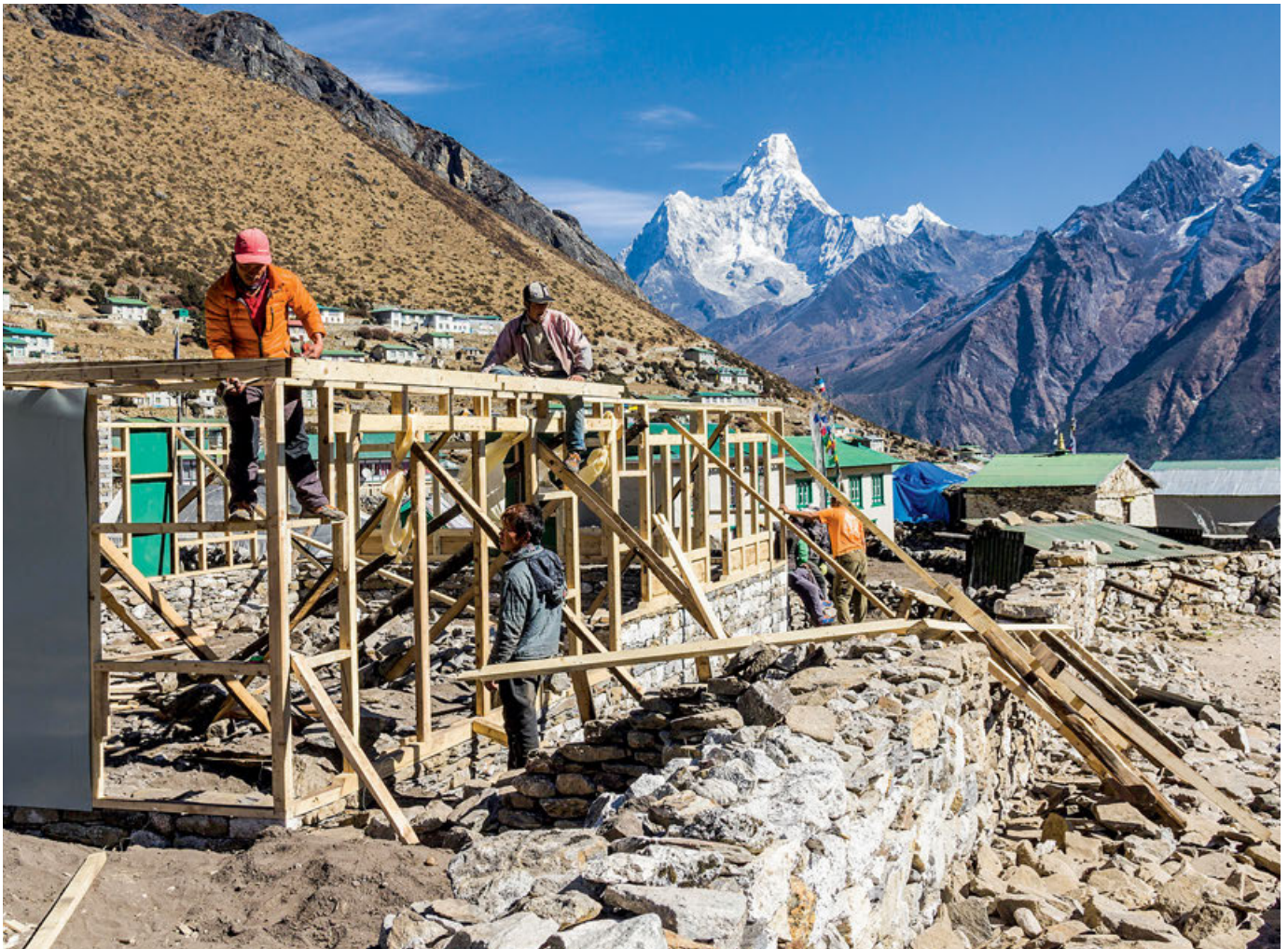
Erbebenkatastrophe 2015 in Nepal: Das Spendengeld der Hilfsorganisationen floss nicht nur in die Soforthilfe, sondern auch in den langfristigen Wiederaufbau des Landes.

Patenschaften einen emotionalen Bezug herzustellen, um Dauerspendsen zu erhalten.