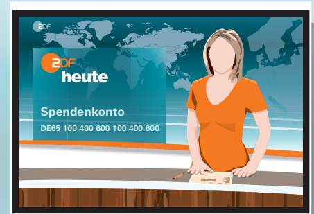
Spenden-Iban des ZDF wird eingeblendet