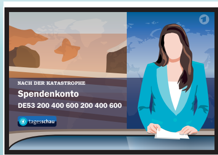
Spenden-Iban der ARD wird eingeblendet