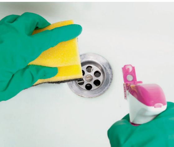
Hilfe bei dicken Belägen. Kraftreiniger setzen in der Regel auf starke Säuren.