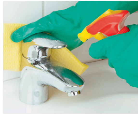
Gegen den täglichen Schmutz. Badreiniger säubern eher mit milden Säuren.

Echte Schnäppchen. Die guten Badreiniger kosten nur zwischen 10 und 16 Cent pro 100 Milliliter. Einzige Ausnahme: Sagrotan, der letzte in der Reihe der Guten, ist mit 53 Cent je 100 Milliliter das teuerste Spray, aber keinesfalls das beste.