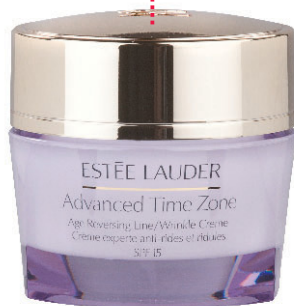
2 Estée Lauder

„... um das Erscheinungsbild von Falten und feinen Linien sichtbar zu reduzieren.“