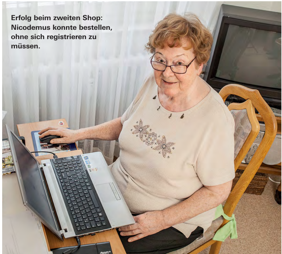
Erfolg beim zweiten Shop: Nicodemus konnte bestellen, ohne sich registrieren zu müssen.