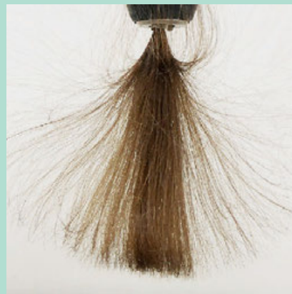
Elektrisiert. Mit aufgeladenem Echthaar wird geprüft, ob Ionen wirken.

Unter den Haartrocknern mit Ionenfunktion schneidet Braun HD710 für etwa 37 Euro als einziger sehr gut ab. Bei ihm zeigen die Ionen die deutlichste Wirkung: Er glättet statisch aufgeladene Haare am besten. Gut und deutlich günstiger sind die Modelle von Edeka , Grundig und Real für je zirka 20 Euro. Unter den Föhnen ohne Ionenfunktion schneiden drei von fünf mangelhaft ab, nur zwei sind gut. Einer der guten ist ein echtes Schnäppchen: Ok OHD 202-S für etwa 10 Euro.