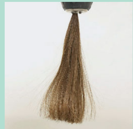
Gebündigt. Brauns Ionen-Luft entlädt und glättet das Haar in Sekunden.