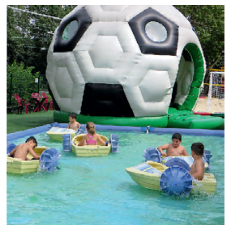
Power Paddler. Bötchen fahren im schönen Außenbereich der Kinderwelt.