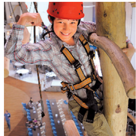
Hochseilklettern. Sensapolis bietet einen Klettergarten in luftiger Höhe.

Tipps Auswahl. Einen Überblick über Hallenspielplätze bietet www.hallenspielplaetze.de . Mit mehr als 300 Einträgen informiert die vom Verband VDH initiierte Seite www.intobia.de über Öffnungszeiten, Preise und Anreise. Begleitung. Die Kinder kommen meist mit den Eltern oder Großeltern. Viele Hallen erlauben die Nutzung für Kinder auch ohne Begleitpersonen. Das Mindestalter liegt oft bei acht Jahren. Dafür müssen die Eltern eine Erklärung ausfüllen. Preise. Der Eintrittspreis beträgt für Kinder zwischen 6 und 18 Euro, Kleinkinder zahlen oft nichts. Für einige Attraktionen muss extra bezahlt werden, pro Nutzung sind meist 1 bis 2 Euro fällig. Essen und Getränke. Die meisten Hallen verbieten, Verpflegung mitzubringen, was verbraucherunfreundlich ist. Die Gastronomiepreise in den Hallen sind sehr unterschiedlich. Wir haben die Kosten für Geburtstagsfeiern verglichen. Relativ preiswert sind etwa Kinderwelt in Recklinghausen, Molli Bär in Molbergen und Spielarena in Aalen.