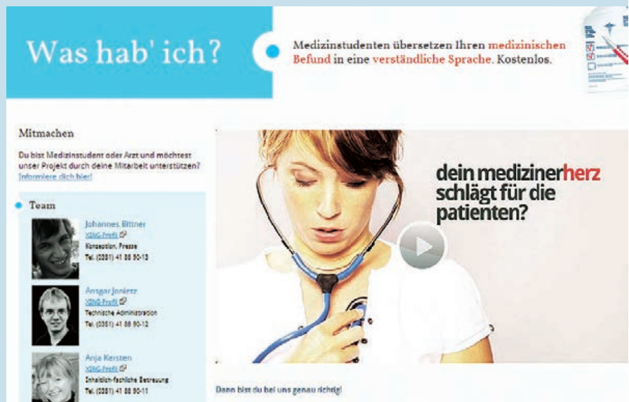
Medizinstudenten hatten eine Idee, die bei Patienten gut ankommt: Sie übersetzen Krankheitsbefunde in laienverständliche Sprache. Interessenten müssen mit Wartezeiten rechnen.

test-Kommentar: Ein nützliches Angebot für Patienten, die ihre Krankheit besser verstehen wollen. Zwar waren nicht alle Befundübersetzungen übersichtlich und klar aufgebaut, doch die fachliche Qualität war insgesamt in Ordnung und gut verständlich.