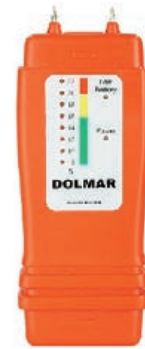
Dolmar MM-100 ca. 20 Euro

test-Kommentar: Liefert nützliche Orientierungswerte – auch bei sehr feuchtem Holz. Mit Ersatzdornen und zusätzlicher Einschlagsonde für hartes Holz. Klare Menüführung, aber Inbetriebnahme etwas aufwendig. Kalibrierung für verschiedene Holzarten möglich. Umfangreiche Anleitung.