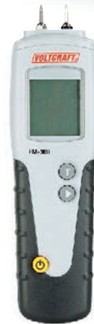
Conrad/Voltcraft FM-300 ca. 85 Euro

test-Kommentar: Billiges Messgerät, das auch bei feuchtem Holz nützliche Orientierungswerte liefert. Bei sehr feuchtem Material (ab etwa 40%) wird eine Messbereichsüberschreitung angezeigt. Bedienung intuitiv möglich, Anleitung verbesserungsbedürftig. Ärgerlich: Messdorne verbiegen leicht.