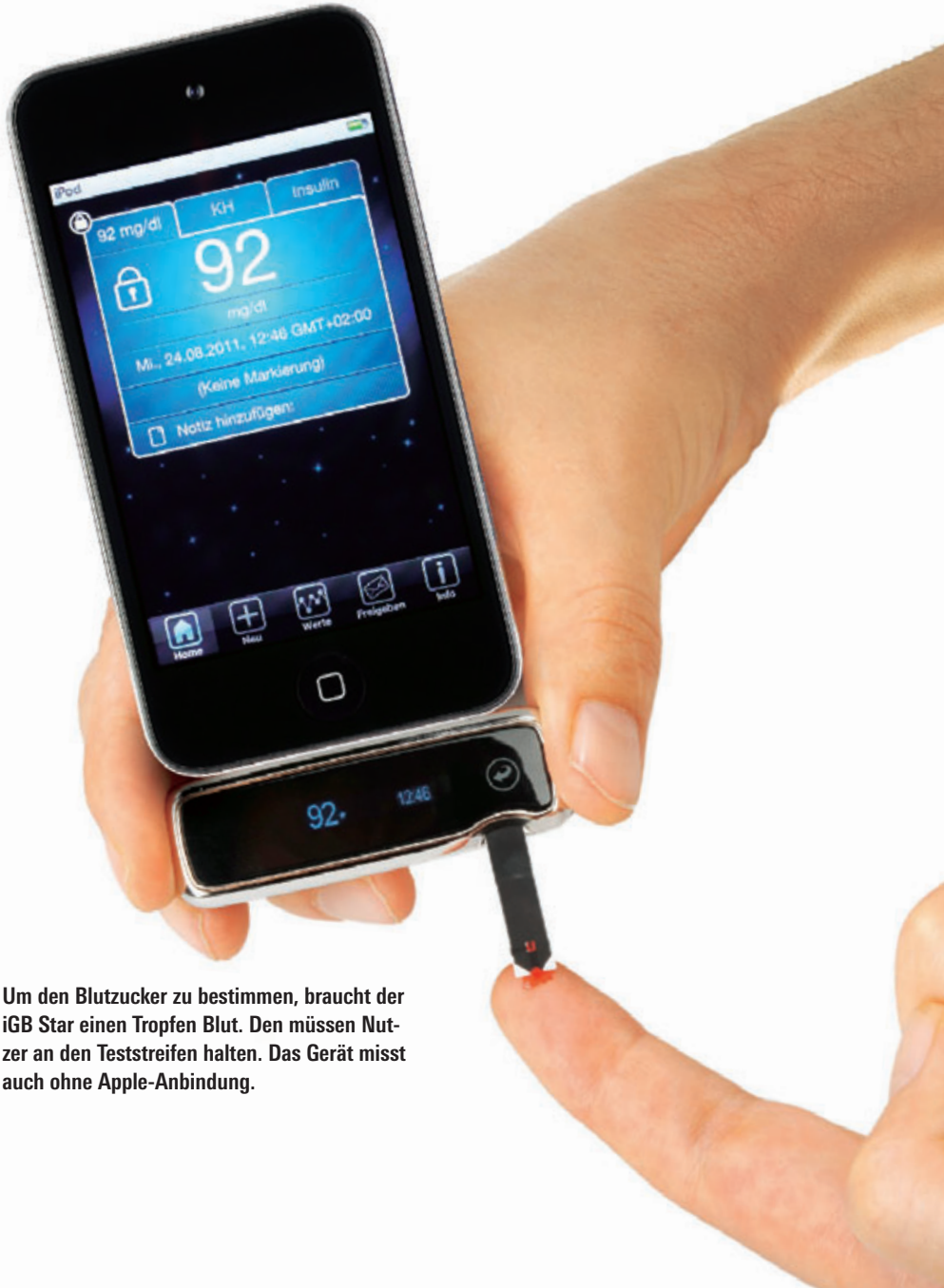
Um den Blutzucker zu bestimmen, braucht der iGB Star einen Tropfen Blut. Den müssen Nutzer an den Teststreifen halten. Das Gerät misst auch ohne Apple-Anbindung.

test-Kommentar: Der Winzling misst so genau wie unser Kontrollgerät und ist praktisch zum Mitnehmen. Er braucht zum Messen nur wenig Blut (etwa 0,5 Mikroliter) – dafür reicht oft ein zarter Piekser. Aber: Es fällt nicht ganz leicht, vom Minidisplay abzulesen, die Miniteststreifen zu handhaben und mit den Daten im iPhone umzugehen.