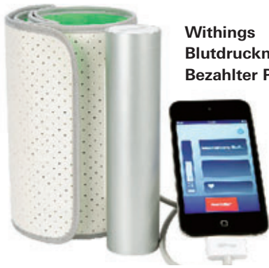
Withings Blutdruckmessgerät. Bezahlter Preis: 128 Euro.