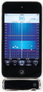
iGB Star. Blutzucker- messgerät. Bezahler Preis: 59 Euro.