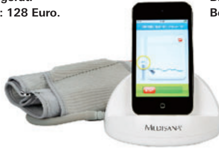
Medisana iHealth Blutdruckmesssystem. Bezahlter Preis: 149 Euro.