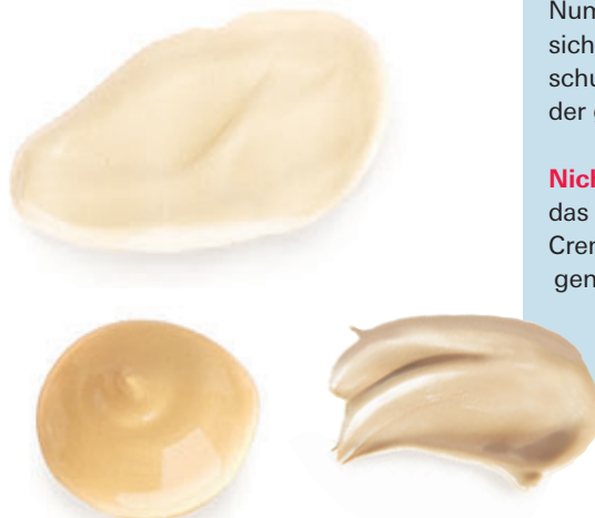
Tabelle auf Seite 32.

Tipp: Tragen Sie bei viel Sonne deshalb lieber ein richtiges Sonnenschutzmittel unter der getönten Tagescreme auf. ■